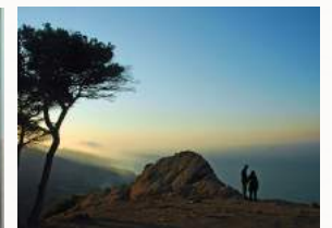
R'Milat, la forêt Perdicaris