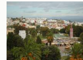
Blick aus dem Zimmerfenster von Matisse

Wir entdecken viele interessante Spuren, die von der Vielfalt und vom friedlichen Zusammenleben unterschiedlicher Lebensformen erzählen.