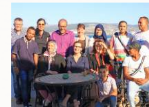
Besuch bei den Jbalia, der Bergbevölkerung im Norden

8 Tage. Wir setzen die Fotografie ein, um uns selbst und die andern besser kennenzulernen. Wir erforschen Tanger und den Norden Marokkos. Wir treffen interessante Leuten und machen Erfahrungen abseits vom Tourismus. Nach dem Workshop macht Amsél Sie bekannt mit Persönlichkeiten der Stadt und zeigt Ihnen ihre Geheimtipps. (Kosten alles inkl., ohne Flug: CHF 1800.-)