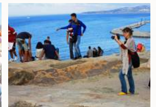
Bei den Phönizischen Gräbern