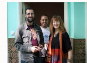
Begegnungen und Austausch